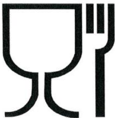
Рис.1. Упаковка (укупорочные средства), предназначенная для контакта с пищевой продукцией

Символы, наносимые на маркировку упаковки (укупорочных средств)